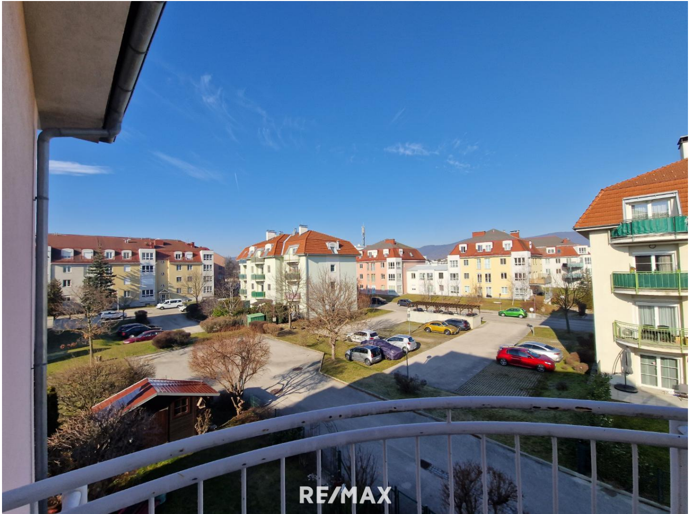
Aussicht vom Balkon