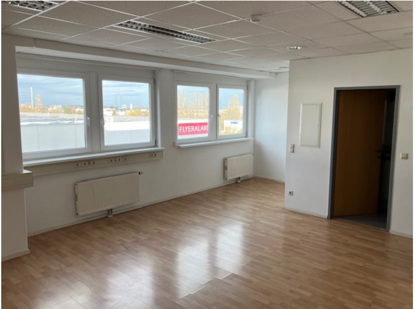
Bürofläche Top 21