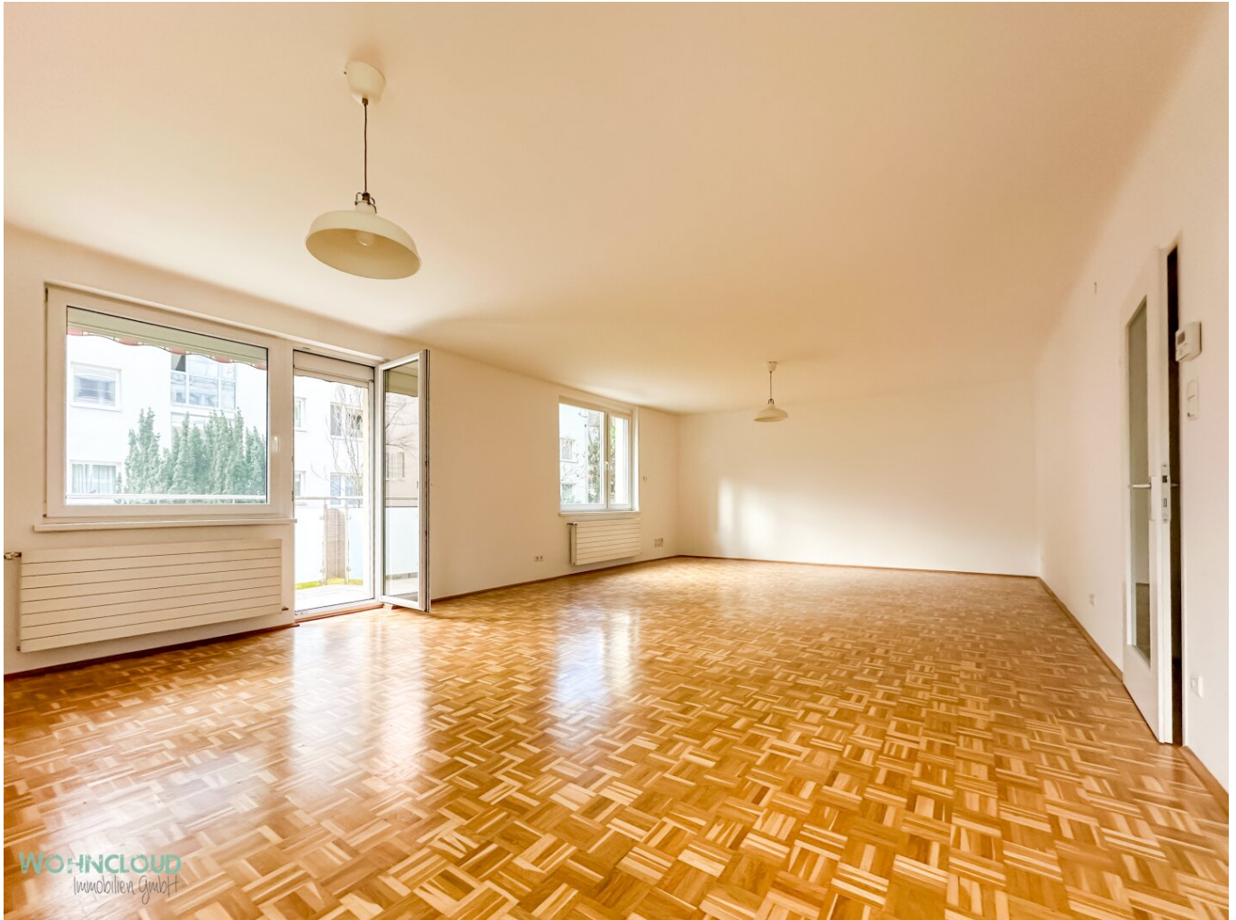
großzügiges Wohnzimmer mit Loggia