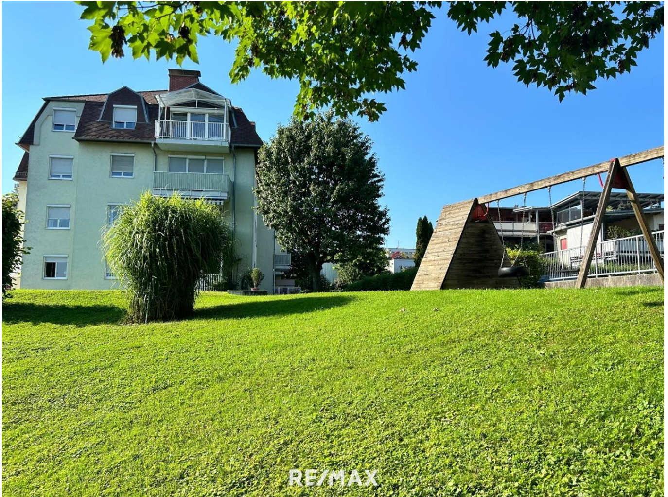
Wohnhaus mit Garten