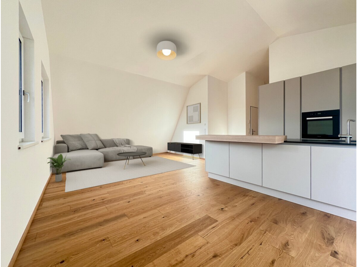
Rendering - Wohn- und Essbereich