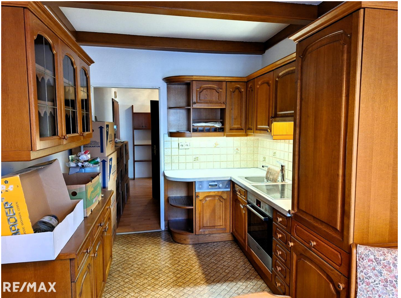
Küche mit Blick in den Vorraum