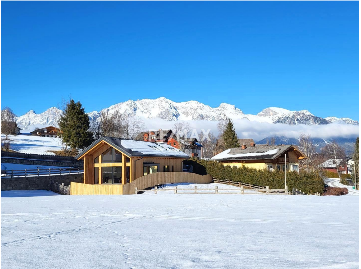
Außenansicht Blick auf den Dachstein