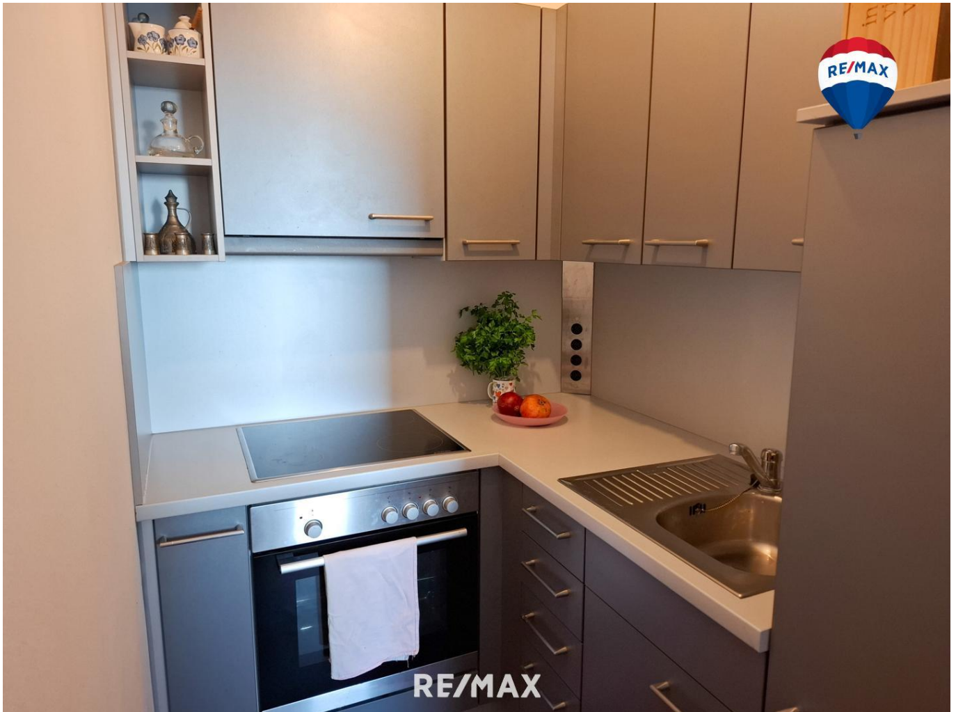
Titelbild - Küche