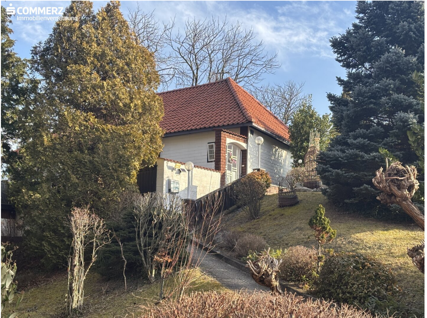
Haus mit Garten