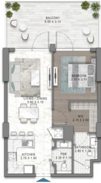
1BR - TYPE A8