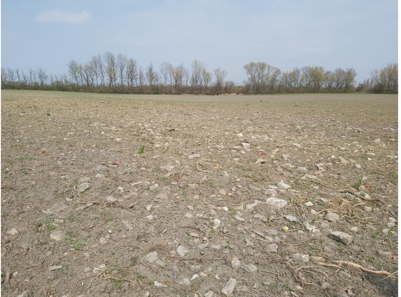
Erdfläche vor Ort