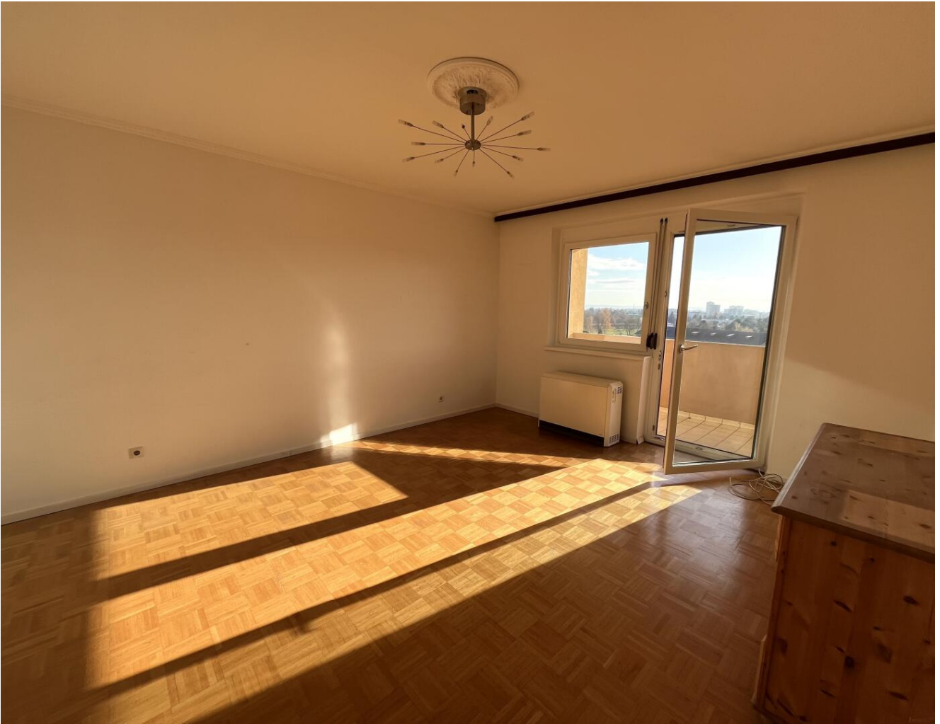
Wohnzimmer mit Loggia

Provisionsfrei für den Käufer! 4 Zimmerwohnung mit Loggia, Tiefgarage, großer Keller, herrlicher Weitblick.