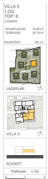
Villa 5 top 6