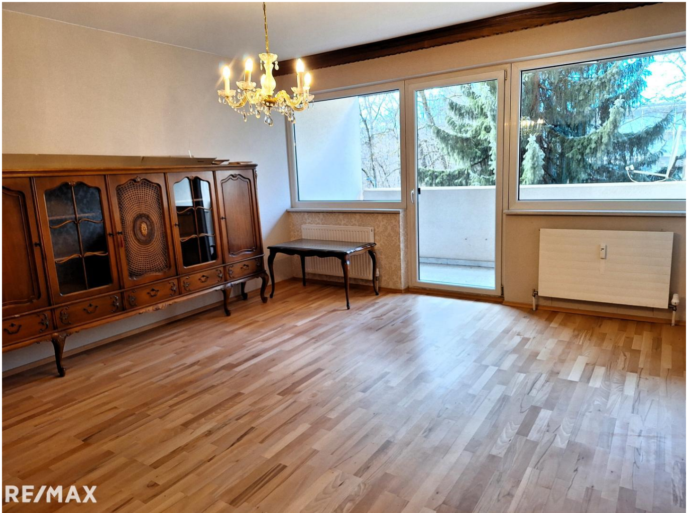
Wohnzimmer mit Loggia nach Westen