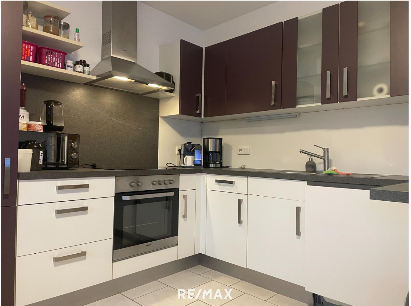
RE/MAX Wohnung Wernstein (1)