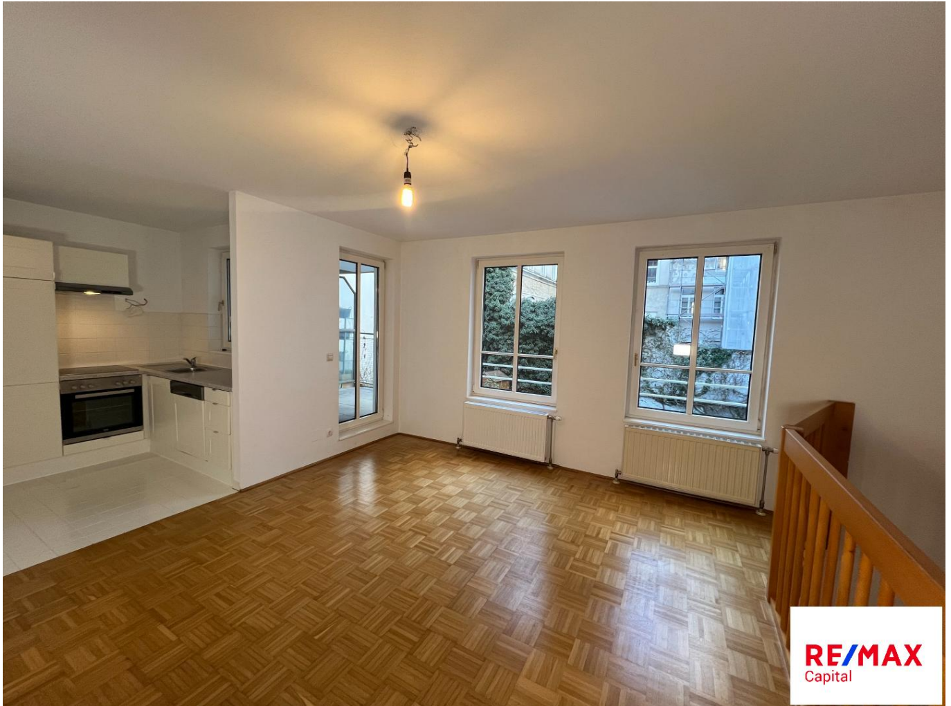
Essbereich Ansicht 2