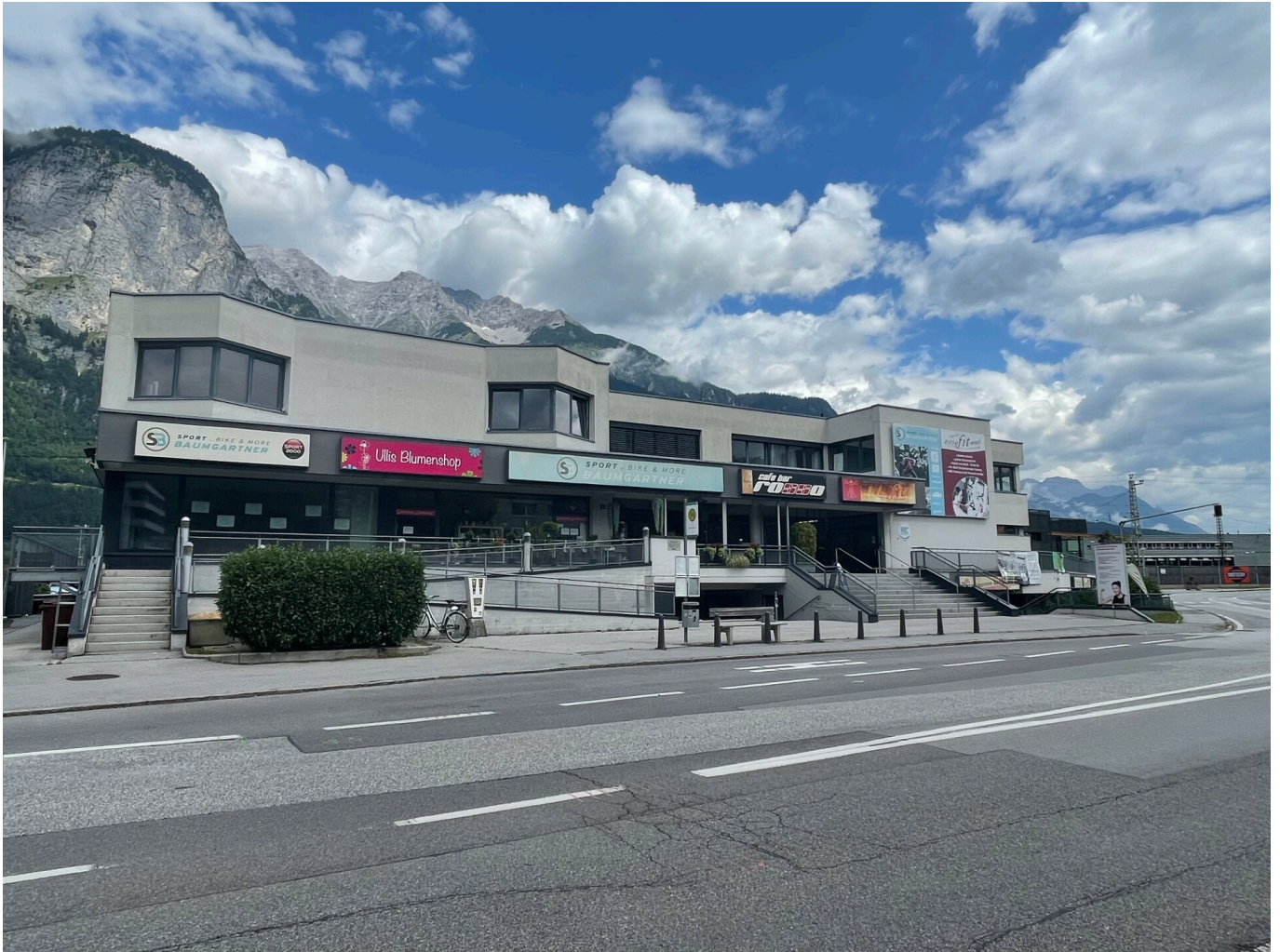
Außenansicht - Aflingerstraße 2, Völs