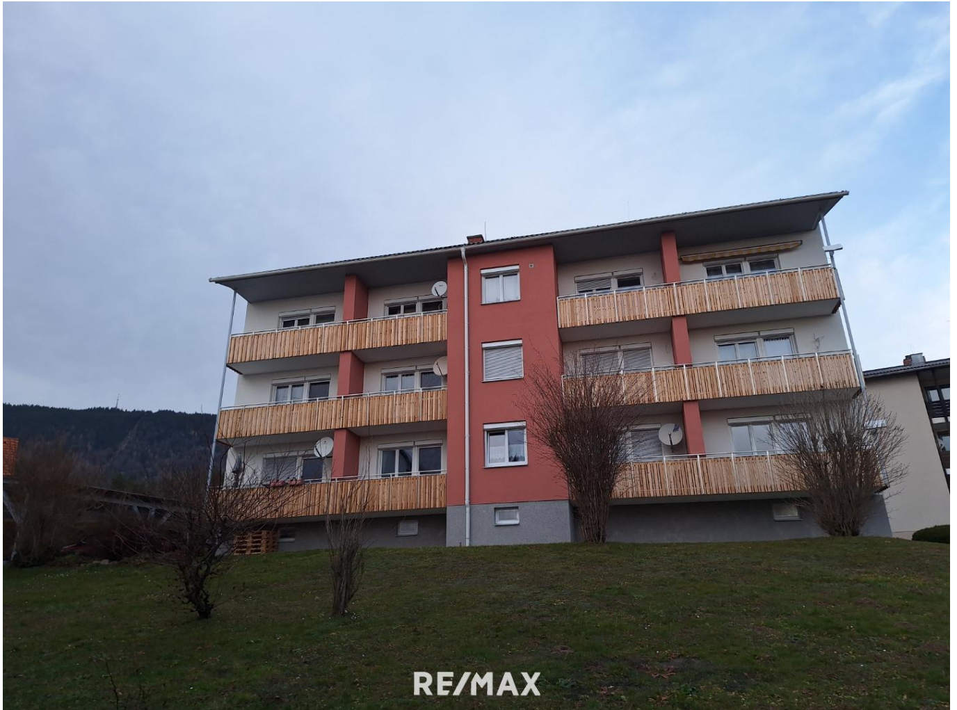
Ansicht Wohnhaus Süd-West