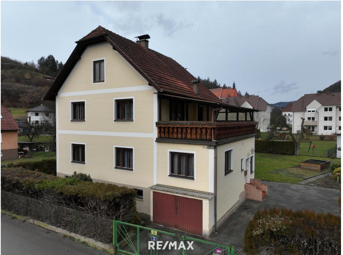
Wohnhaus mit großem Garten