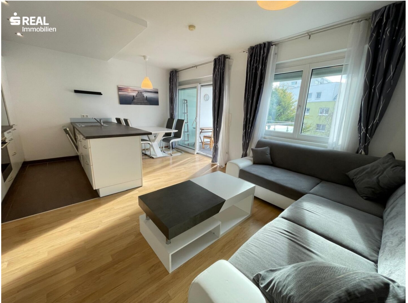
Wohnzimmer Perspektive 2