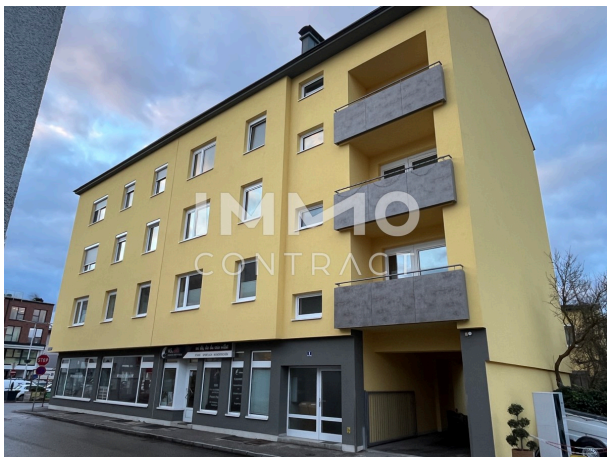
Wohnung Tür 4