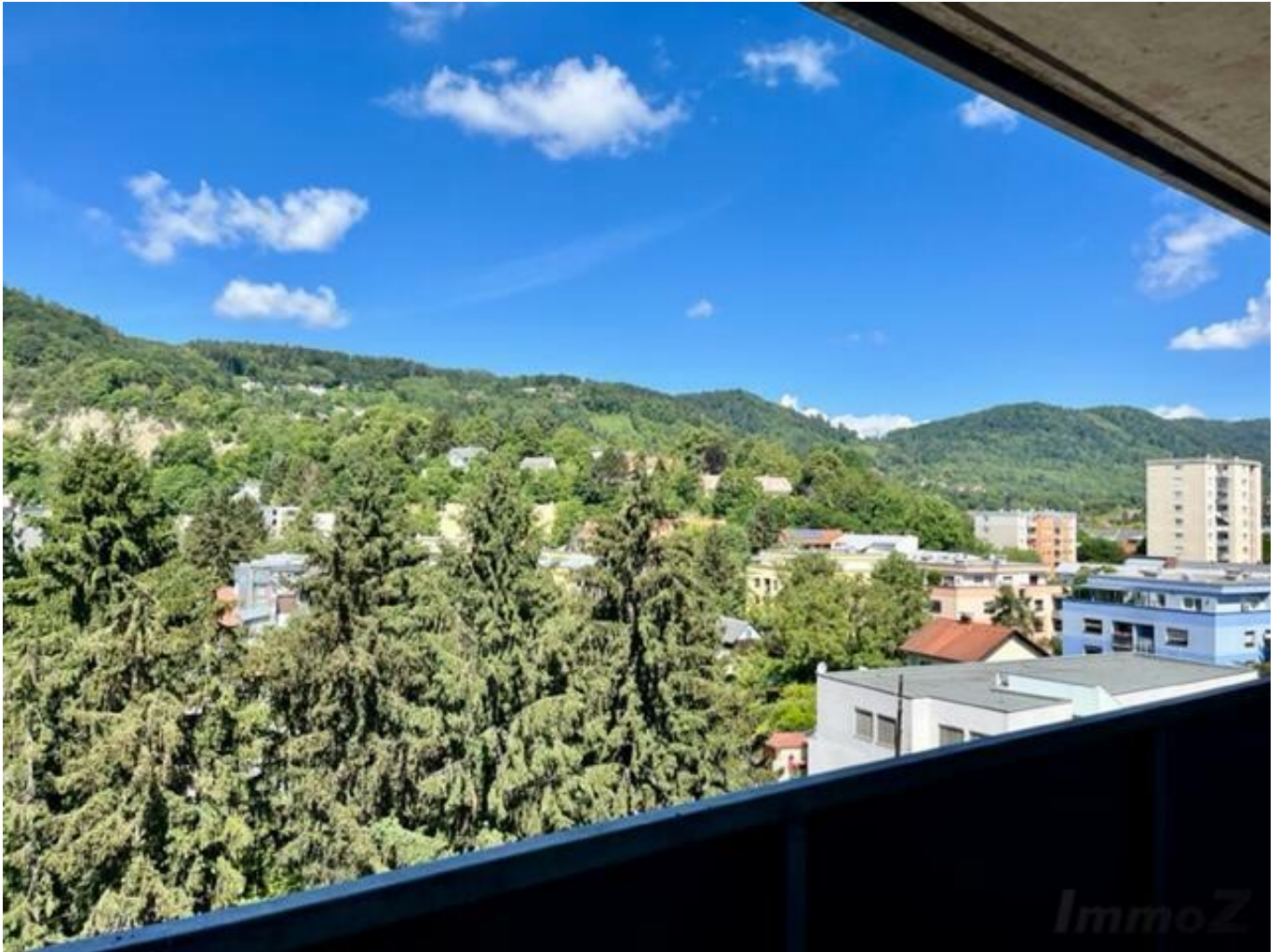
Aussicht im Sommer

ab 1.4.2025: Terrassenwohnung - 2-Zimmer im 6.OG.