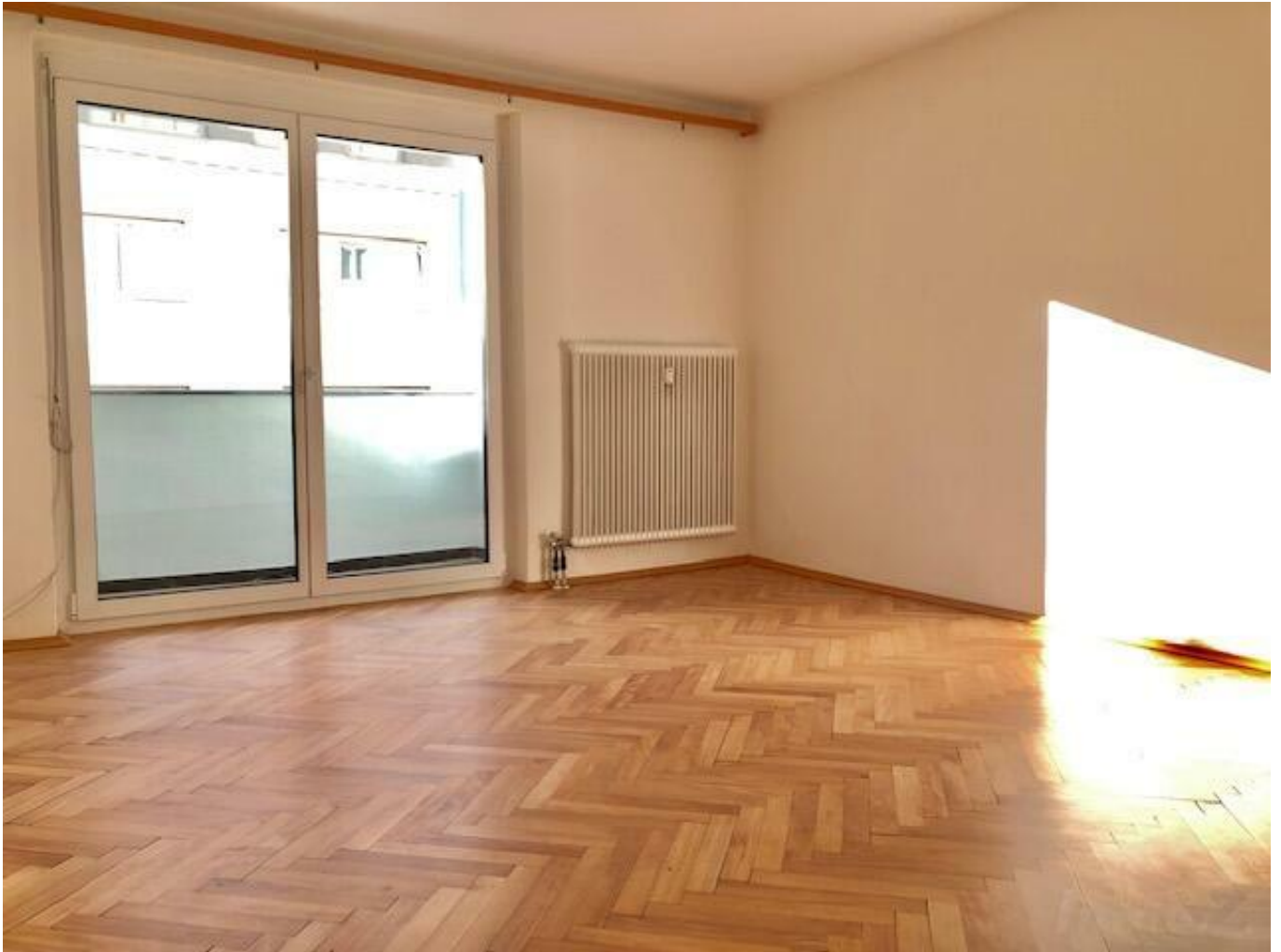
Wohnzimmer mit Zugang zur Loggia