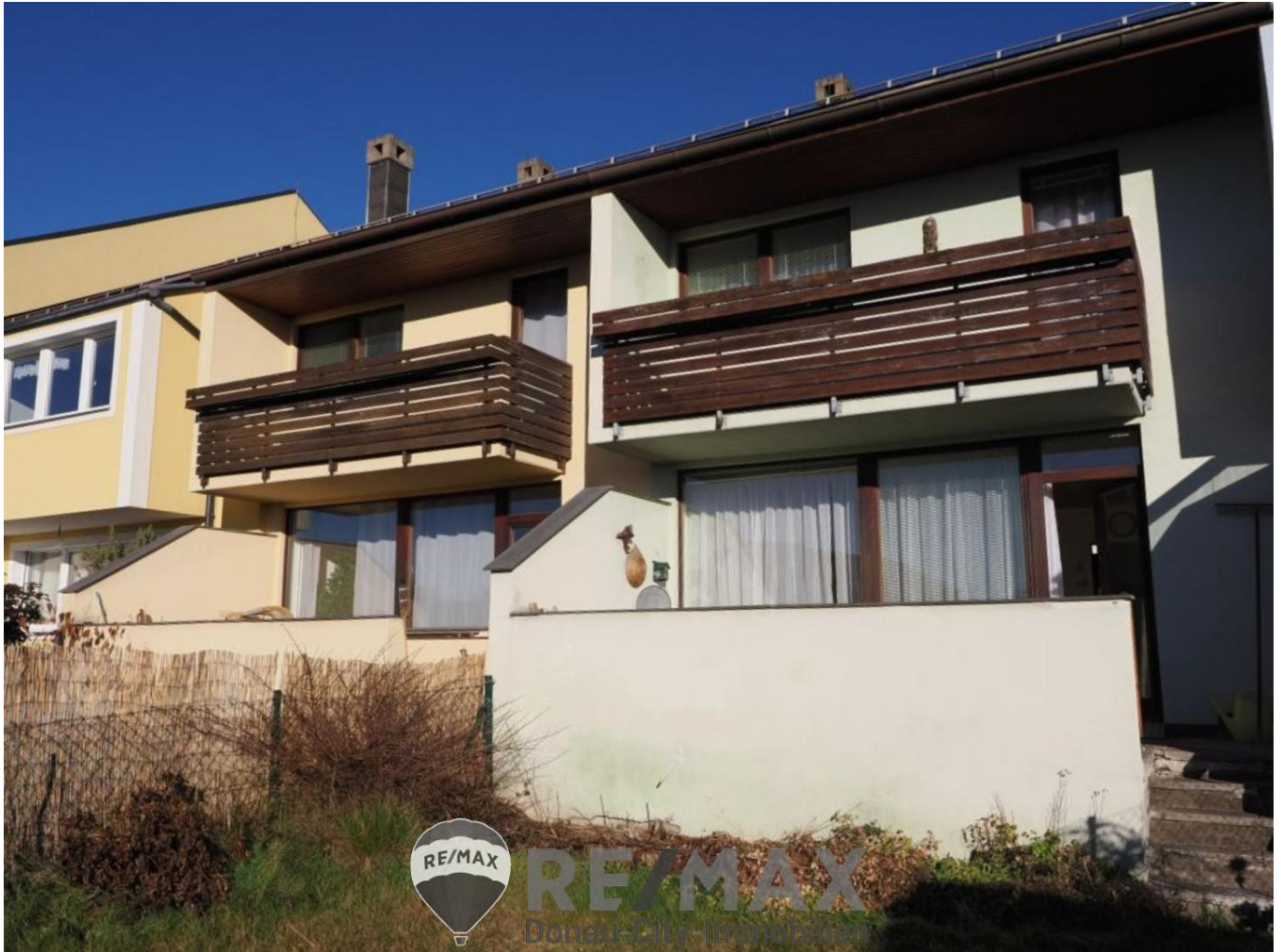
Aussenansicht Reihenhaus in 3910 Zwettl