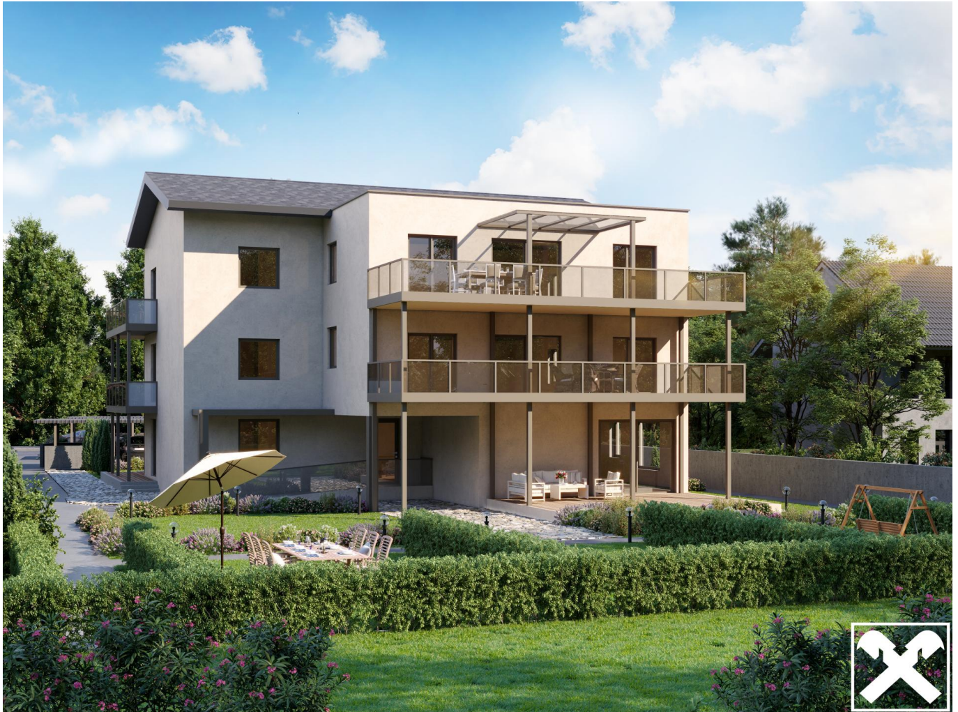
Außenansicht bei Tag

Objektnummer: 00150008770002 Eine Immobilie von Raiffeisen Kärnten