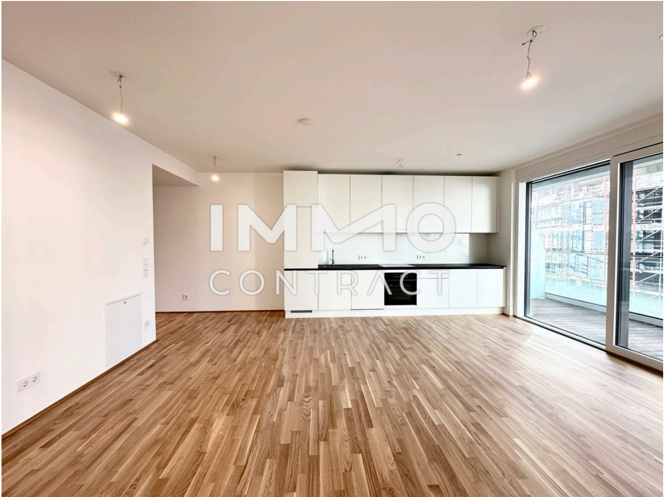
View 3 1

Sommer, Sonne und kühle Drinks! Bald ist es wieder soweit und Sie können die Donauinsel genießen