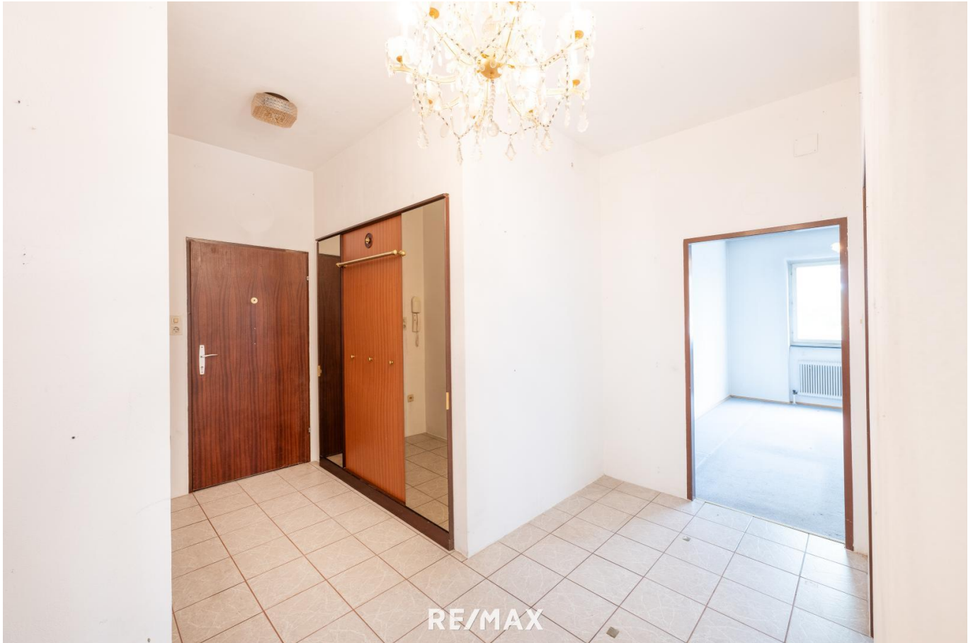
Foyer mit Garderobe