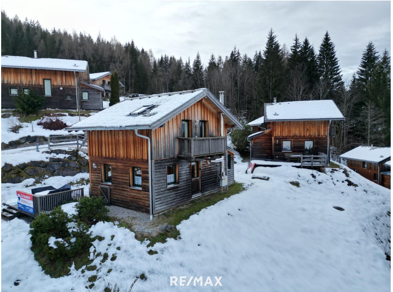
Außenansicht Drohne 3 REMAX Banner