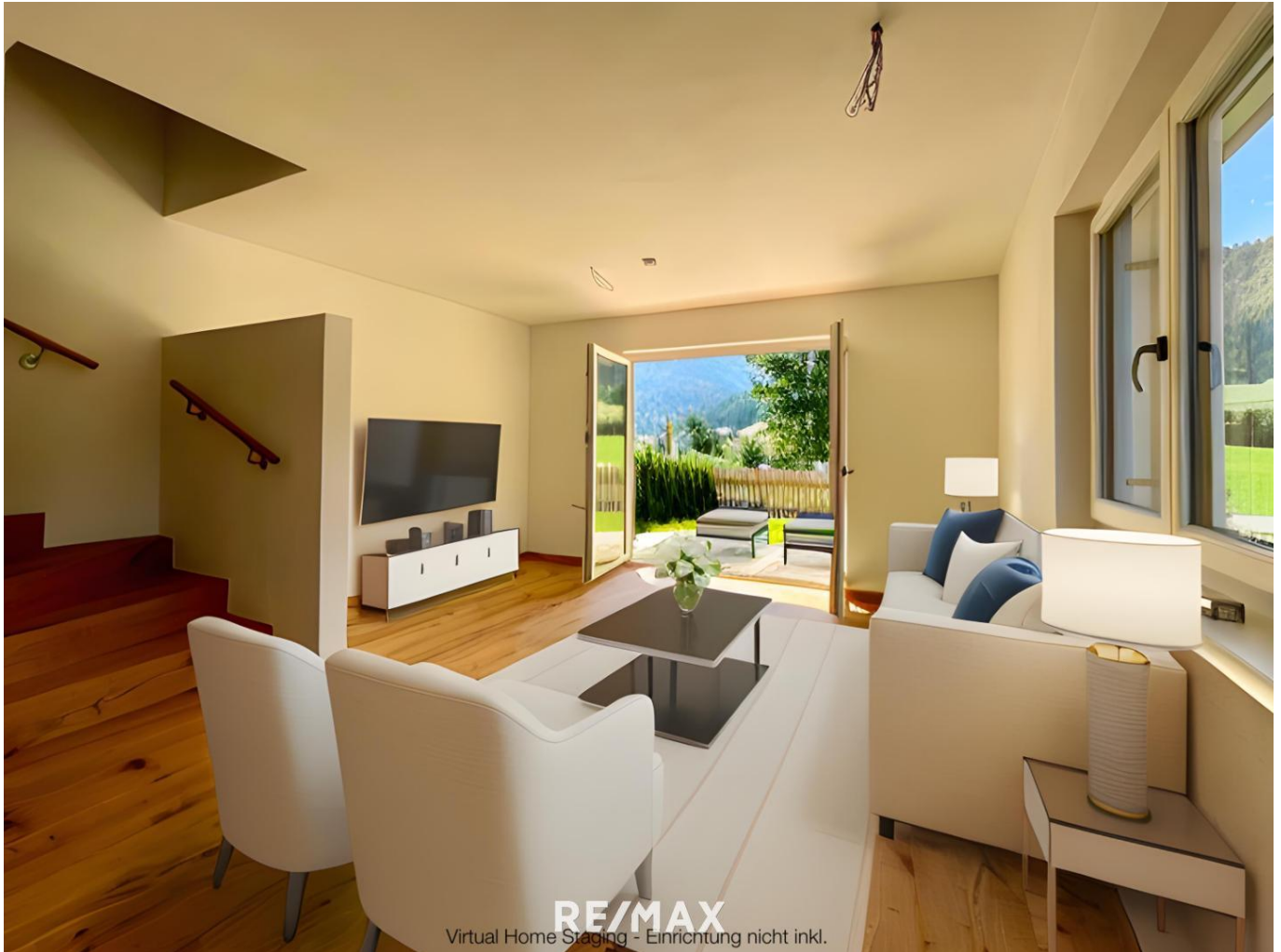
Wohnzimmer Design Vorschlag