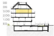
Klenaugasse 3, 1220 Wien Top 23, 3. Obergeschoß