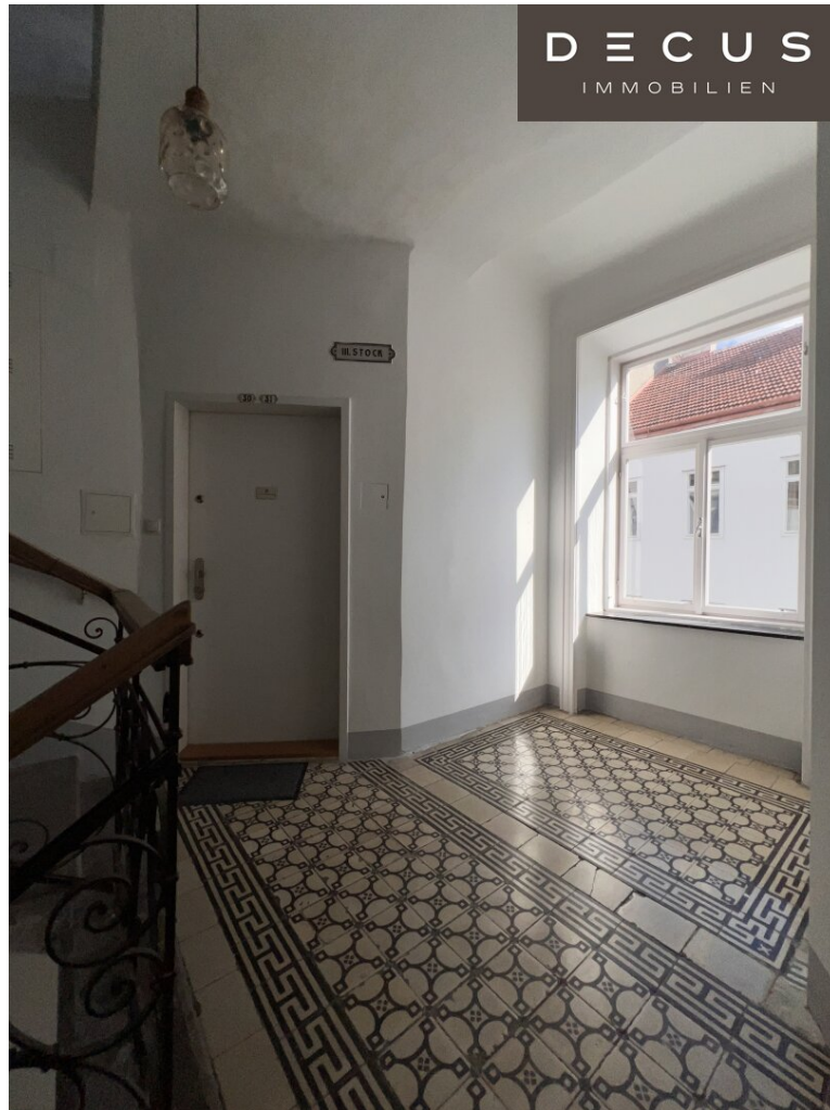
Stiege II - 3. Stock