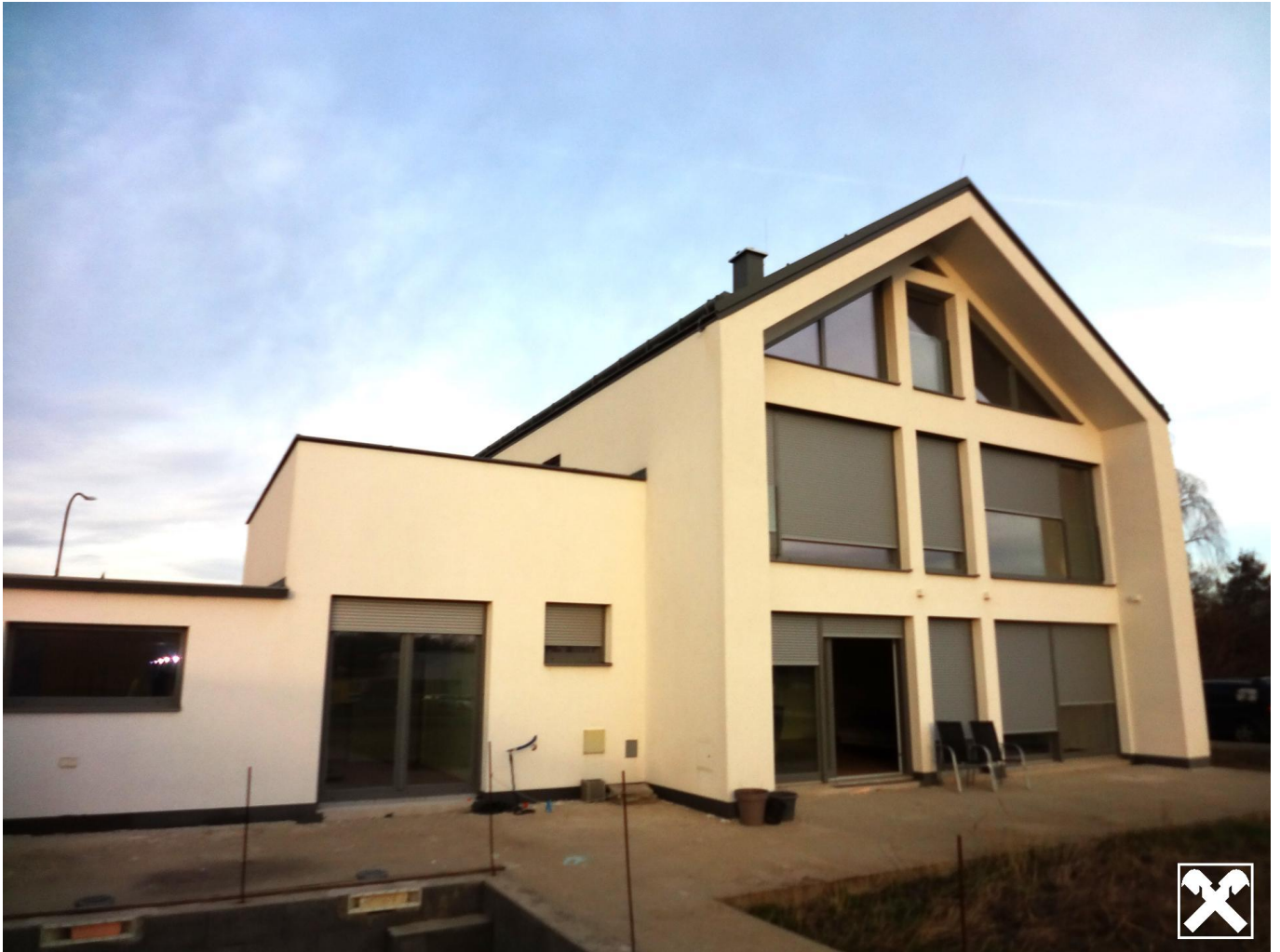
Ansicht vom Garten