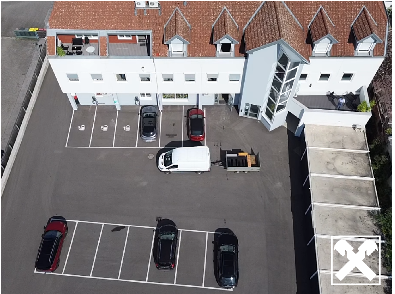
Vogelperspektive auf Parkplatz